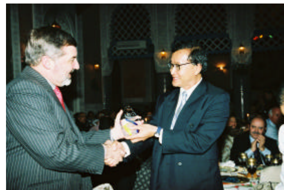
LI-Präsident Lord Alderdice überreicht den Freiheitspreis der LI 2006 an Sam Rainsy

Auf dem diesjährigen Kongress der Liberal International wurde ebenfalls der LI-Freiheitspreis 2006 überreicht, der diesmal an Sam Rainsy, Parteichef der Sam Rainsy Party in Kambodscha, ging. Dr. Wolfgang Gerhardt, MdB, Vorsitzender der Friedrich Naumann-Stiftung wurde in Marrakesch in seinem Amt als Vizepräsident der LI bestätigt.