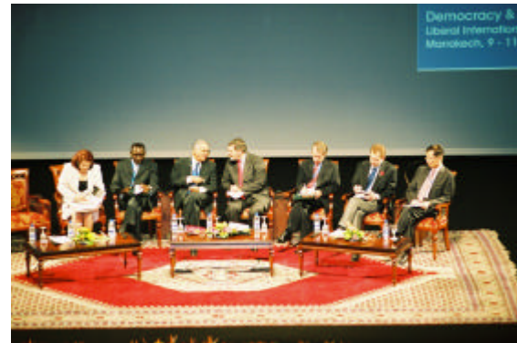
Diskussion im Plenum des LI-Kongresses

Auf dem LI-Kongress konnten 500 Delegierte aus der ganzen Welt begrüßt werden. Über 20 Parteien wurden neu in die LI aufgenommen.