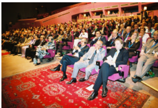
Eröffnung des 54. LI-Kongresses

Auf dem LI-Kongress wurden neben der Themenresolution „Development and Democracy“ Resolutionen zu den Themen „Cuba after the era of Fidel Castro“, „Slovakia“, „Women’s Participation in the Economy for Sustainable Development“ und „Darfur“ beschlossen. Die Materialien finden sich aktuell auf der Website des liberalen Weltverbandes unter www.liberal-international.org .