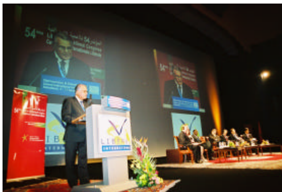
Eröffnung des 54. LI-Kongresses in Marrakesch

Der 54. LI-Kongress fand unter dem Motto „Development and Democracy“ (Entwicklung und Demokratie) vom 09. bis 11. November 2006 in Marrakesch, Marokko, unter der Leitung von LI-Präsident Lord Alderdice statt.